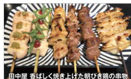
田中屋 香ばしく焼き上げた朝ひき鶏の串物