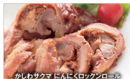
かしわサクマ にんにくロックンロール